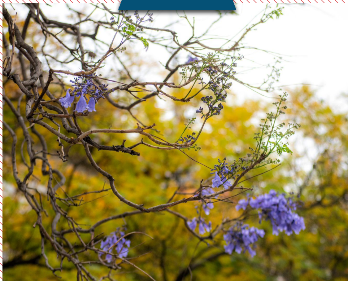
¿Jacarandas en invierno en CDMX?