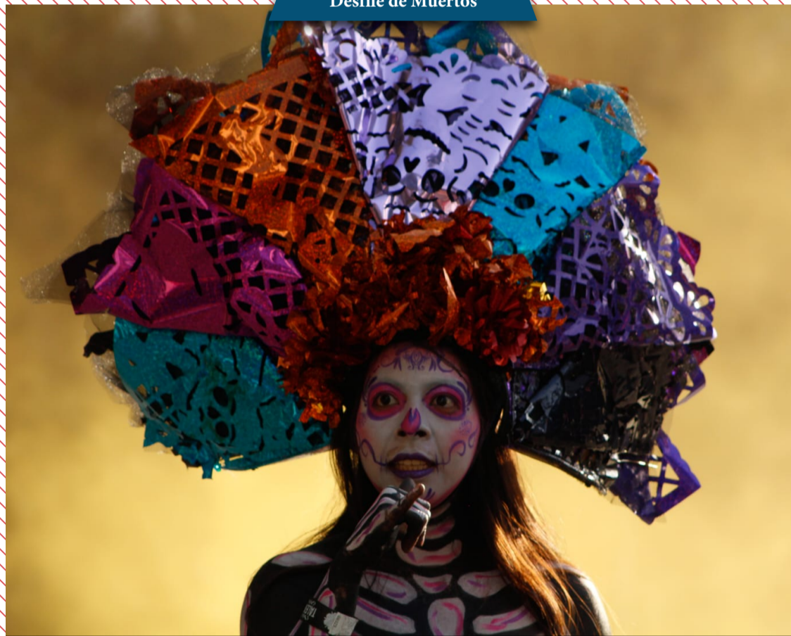
Poner la foto de Desfile de Muertos