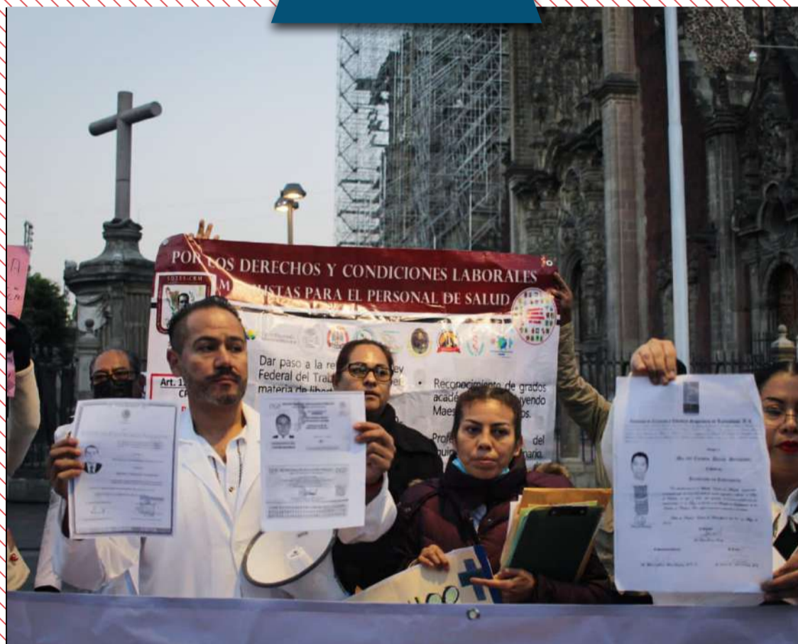
Los médicos se levantan en la CDMX