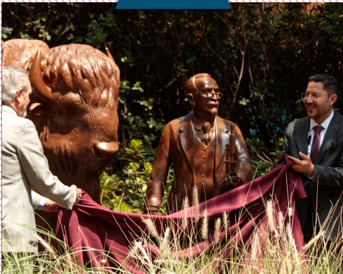
¡100 años de Chapultepec!

PERIODISMO SIN FINES DE LUCRO CAPITAL CDMX www.capital-cdmx.org