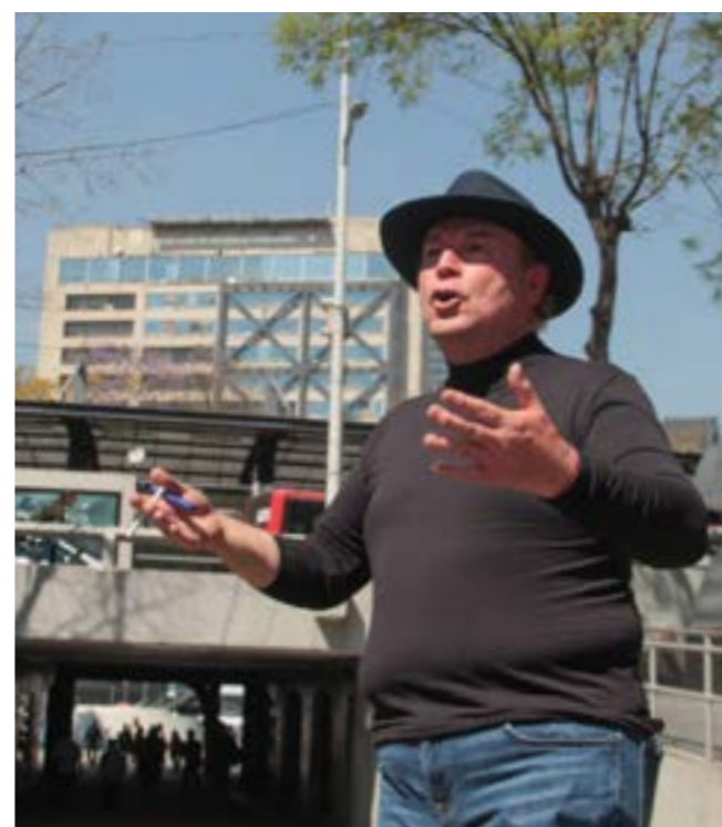
FOTOGRAFÍAS: Obturador MX

OBTURADOR MX https://esimagen.mx/media_album/corruptour/