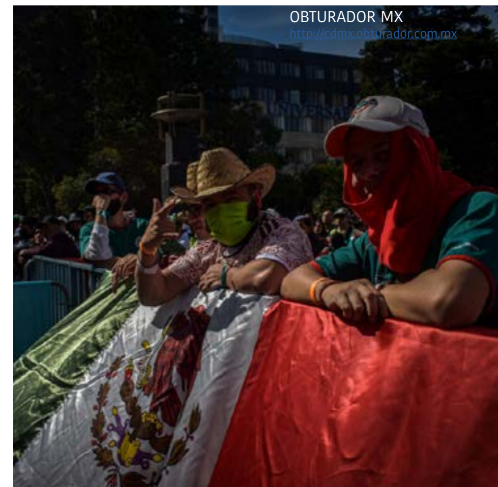
OBTURADOR MX http://cdmx.obturador.com.mx