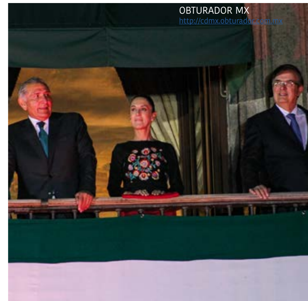
OBTURADOR MX http://cdmx.obturador.com.mx