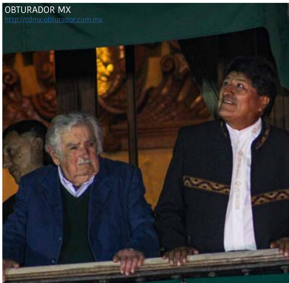
OBTURADOR MX http://cdmx.obturador.com.mx