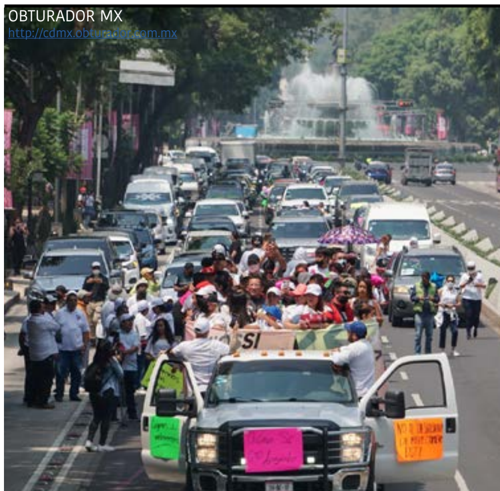
OBTURADOR MX http://cdmx.obturador.com.mx